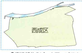
●青線部分のピックアップです